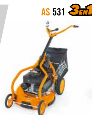
AS 531 3EN1

Vous aimez le beau gazon vert? Votre terrain est plat ou en pente? Il existe des tondeuses à gazon AS pour tous les usages, même avec 4 roues motrices, freins et marche arrière.