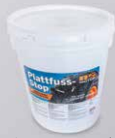
Quantité de remplissage voir: www.as-motor.fr/produits/liquide-anti-crevaison-copie-20/

Scelle rapidement et éteint crevaisons dans tous les pneus. Réduit les temps de défaillance en raison de crevaisons.