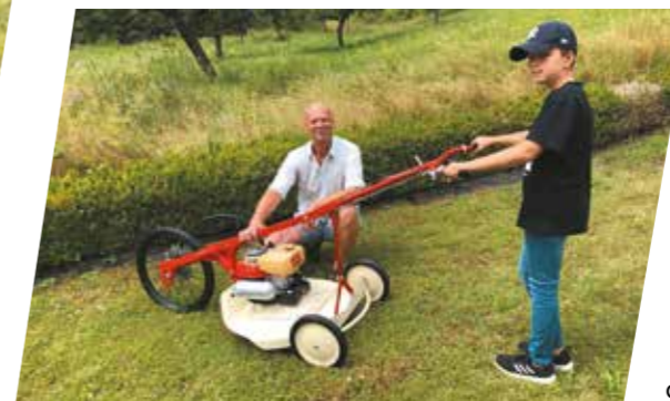
Une débroussailleuse AS 26 AH 4 de 1976. Parfaitement restaurée par un client passionné d'AS-MOTOR. Roue AV motrisée par arbre flexible. 92 cm3, moteur 2-temps AS, 4,7CV à 5.200 Tr./min.

Le nom Allmäher® est explicite : il n'y a aucune tâche qui leur résiste. Elles sont aussi performantes et actuelles qu'il y a 60 ans. On ne change pas ce qui fonctionne déjà !