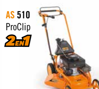
AS 510 ProClip 2EN1