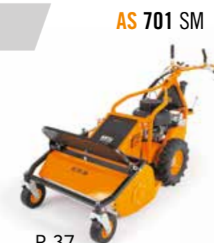
AS 701 SM

Herbe haute avec broussailles, terrains abruptes, grandes surfaces en zones inconnues: Laissez venir ces choses sereinement à vous. Les broyeurs à fléaux AS rejettent les obstacles et répartissent parfaitement.