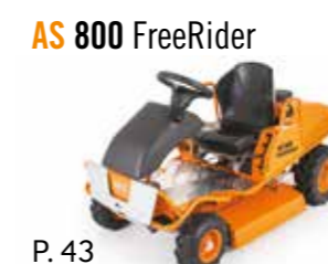
AS 800 FreeRider