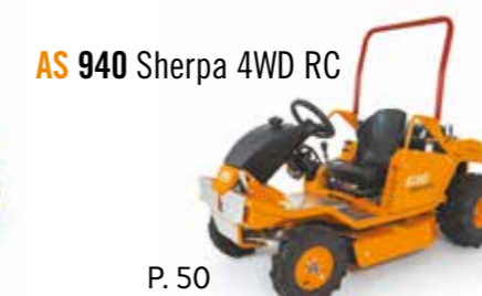
AS 940 Sherpa 4WD RC