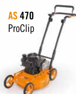
AS 470 ProClip