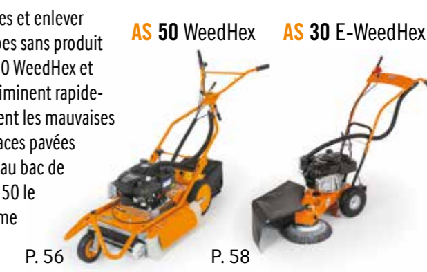
AS 50 WeedHex AS 30 E-WeedHex

Protéger les surfaces et enlever les mauvaises herbes sans produit chimique. Les AS 50 WeedHex et AS 30 WeedHex, éliminent rapidement et efficacement les mauvaises herbes sur les surfaces pavées et bordures. Grâce au bac de ramassage de l'AS 50 le balayage n'est même plus nécessaire.