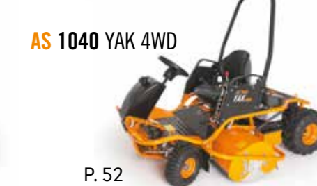
AS 1040 YAK 4WD