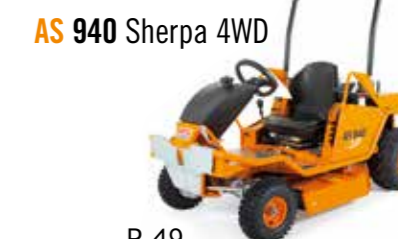
AS 940 Sherpa 4WD