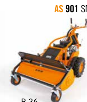
AS 901 SM