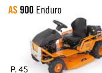
AS 900 Enduro