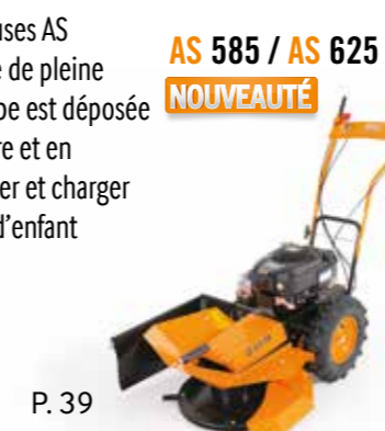
AS 585 / AS 625 NOUVEAUTÉ

Les rotofaucheuses AS coupent l'herbe de pleine longueur. L'herbe est déposée en rangée propre et en andain. Ramasser et charger devient un jeu d'enfant sans tracas.