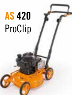
AS 420 ProClip

Tondeuse mulching – l'alternative pour gagner du temps ! Les tondeuses mulching AS broient l'herbe si finement qu'elle est déposée dans le gazon comme "engrais" presque invisible.