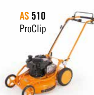
AS 510 ProClip