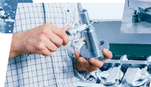
Contrôle précis du vilebrequin