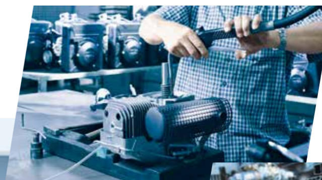
Fabrication des moteurs 2 temps