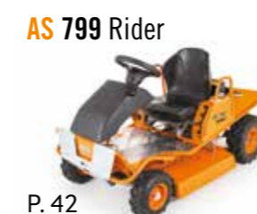
AS 799 Rider

Vous avez un grand projet ? – l'Allmäher autoportée AS vous aide à le réaliser. Que ce soit pour de grandes surfaces, des broussailles, du taillis ou de l'herbe de 1,5 m de hauteur, nos autoportées Allmäher sont idéales. Si en plus, le terrain est pentu voire même très pentu. Vous trouverez forcément le modèle idéal, parmi les neuf modèles proposés, en fonction de votre utilisation que ce soit pour un usage personnel ou professionnel.