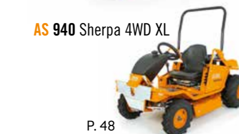
AS 940 Sherpa 4WD XL