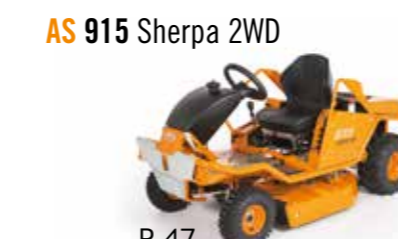
AS 915 Sherpa 2WD