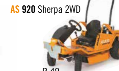
AS 920 Sherpa 2WD