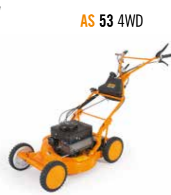
AS 53 4WD