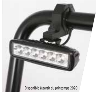
Disponible à partir du printemps 2020